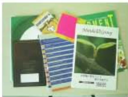
保罗公司日文资料