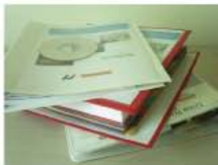
阿尔及利亚Naftec Spa石油公司资料