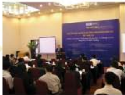
2005年 车载定位导航技术同传现场