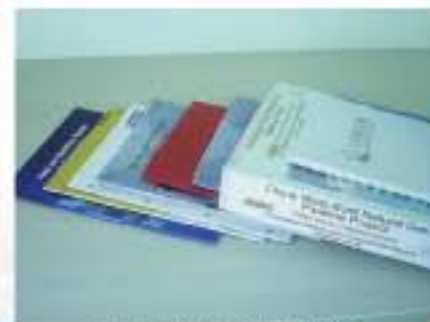
中石油西气东输项目资料, 联合国粮食计划署等机构资料