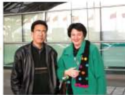
我公司专家在首都机场会见外国合作伙伴