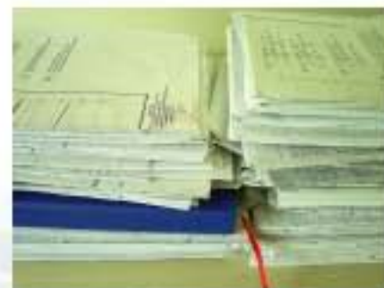
中国机械进出口总公司图纸资料