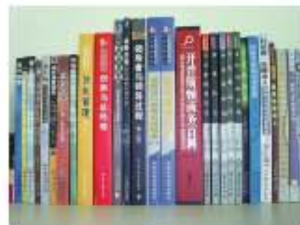
我公司翻译的部分图书