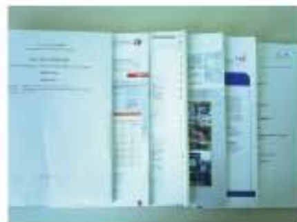
建筑标准, Toronto Stock Exchange, IBI等公司资料